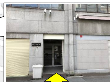
ホリノビル入口 EVで3Fへ