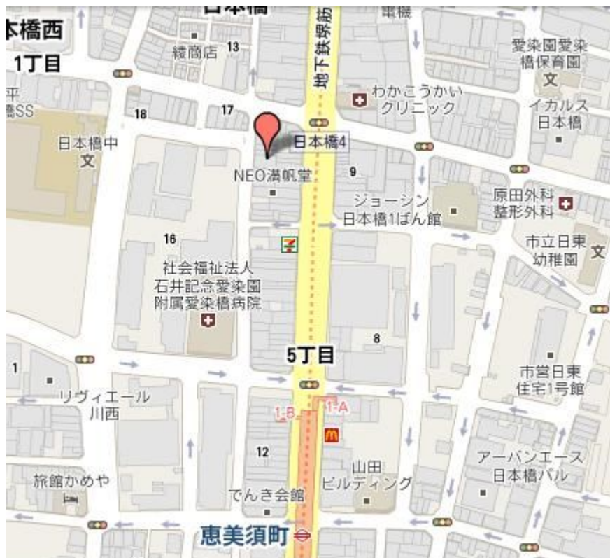
最寄り駅 地下鉄堺筋線 恵美須町駅より谷川ビルまで