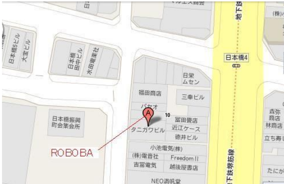
日本橋4丁目交差点付近